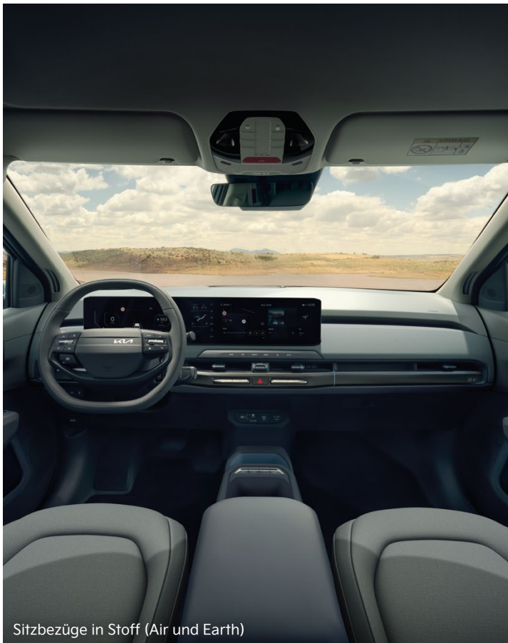
Sitzbezüge in Stoff (Air und Earth)