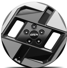
17-Zoll-Leichtmetallfelgen (Serie für Air & Earth)

Bei einigen unserer modernen Metallicfarben werden bewusst unterschiedliche Farbpigmente verwendet. Dadurch können unter bestimmten Lichtverhältnissen, z. B. direktes Sonnenlicht, attraktive Farbeffekte erzielt werden. Zum Teil kann die Farbe changieren, z. B. von Schwarz zu Dunkelblau. Bei den hier abgebildeten Farbdarstellungen kann es aufgrund der Drucktechnik zu Abweichungen zu den Originalfarben kommen. Weitere Informationen zu den Farbeffekten und Grundfarben erhältst du bei deinem Kia-Partner. Metalliclackierungen sind aufpreispflichtig.