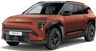
Terracotta Met. (TCT)