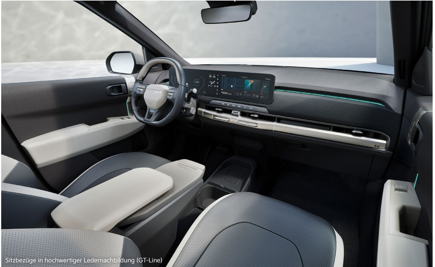
Sitzbezüge in hochwertiger Ledernachbildung (GT-Line)

Progressives Design, viel Platz für bis zu fünf Reisende, clevere und zukunftsweisende Technologien – der vollelektrische Kia EV3 wird dich auf jeder Fahrt inspirieren.