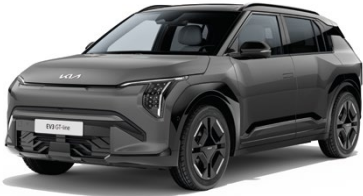
Schiefergrau Met. (EBD)