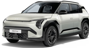
Ivory Silber Met. (ISG)