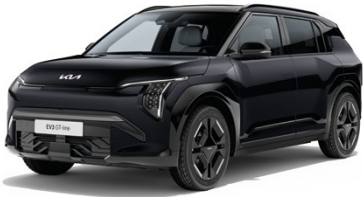
Auroraschwarz Met. (ABP)