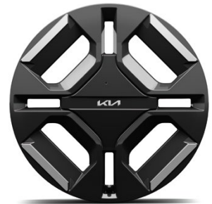
19-Zoll-Leichtmetallfelgen (Serie für GT-Line)