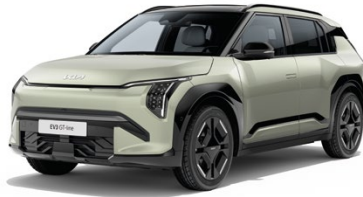
Aventurin Grün Met. (AG3)