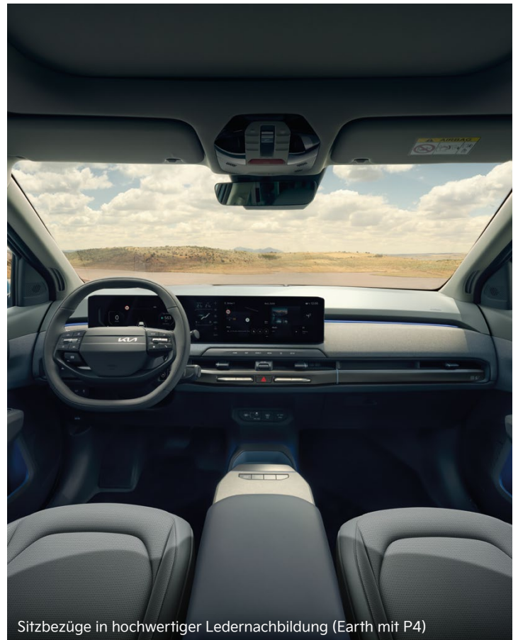
Sitzbezüge in hochwertiger Ledernachbildung (Earth mit P4)