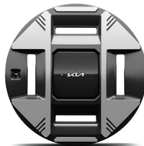
19-Zoll-Leichtmetallfelgen (optional für Earth, Serie für Earth mit Allrad)